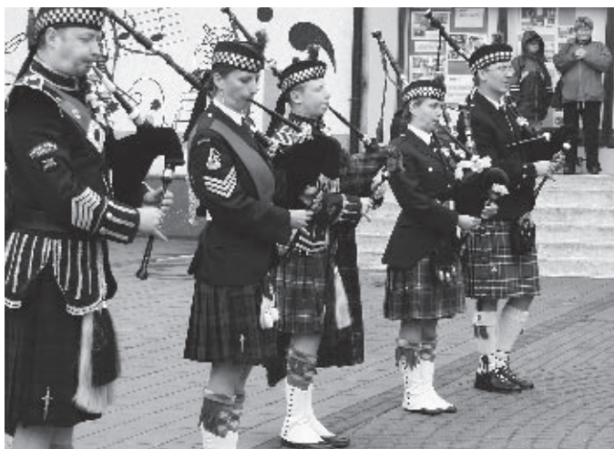
Występ zespołu dudziarzy Pipes & Drums był jedną z atrakcji.