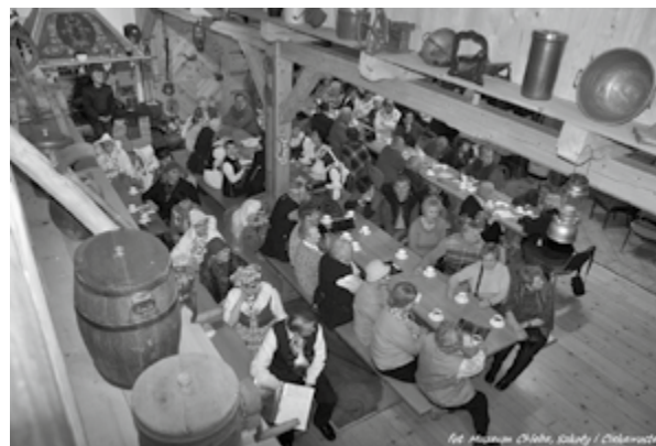
Rozmowy o Śląsku w Muzeum Chleba, Szkoły i Ciekawostek