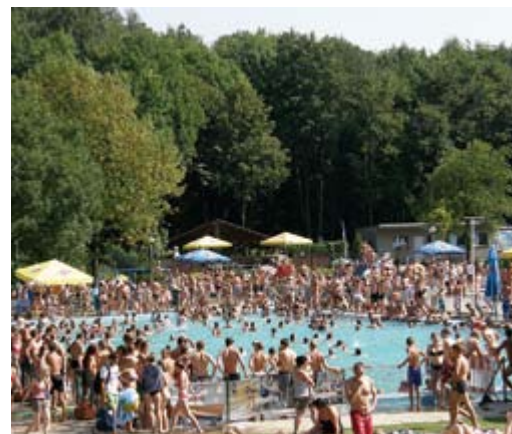
W upalne dni księżogórski basen jest jednym z najchętniej odwiedzanych miejsc w okolicy