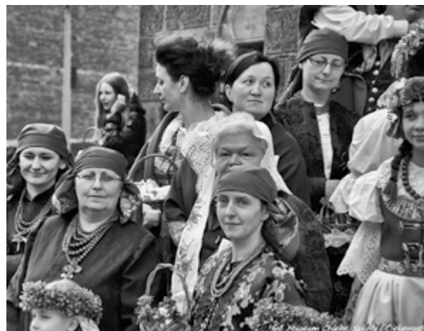
Święcenie potraw w tradycyjnych śląskich strojach w parafii św. Jacka w Bytomiu-Rozbarku