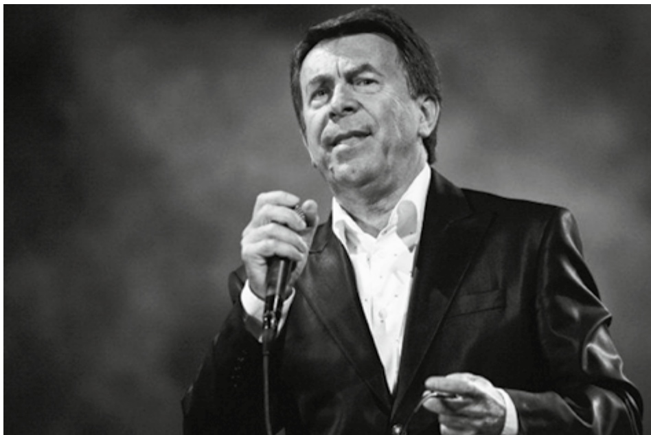
Niedzielną gwiazdą wieczoru będzie Wojciech Gąsowski