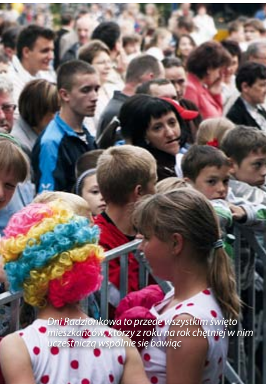
Dni Radzionkova to przede wszystkim święto mieszkańców, którzy z roku na rok chętniej w nim uczestniczą wspólnie się bawiąc

Lombard, Wojciech Gąssowski i muzyczne odkrycie Śląska – zespół Oberschlesien, to największe gwiazdy tegorocznych, siódmych Dni Radzionkova. Kulminacyjne obchody święta miasta odbędą się w dniach 14-16 czerwca.