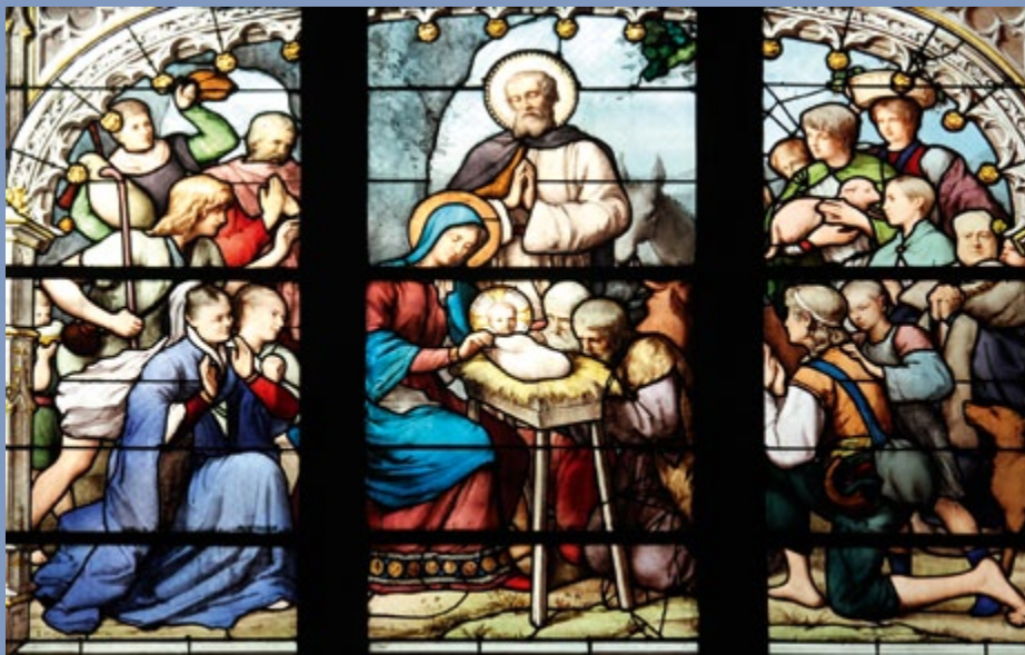
Poklon pasterzy, Domenichino, witraż w Kościele Saint Severin w Paryżu

Wszystkim mieszkańcom życzymy błogosławionych Świąt Bożego Narodzenia. Niech ten wyjątkowy, świąteczny czas będzie pełen radości, ciepła i rodzinnej atmosfery.