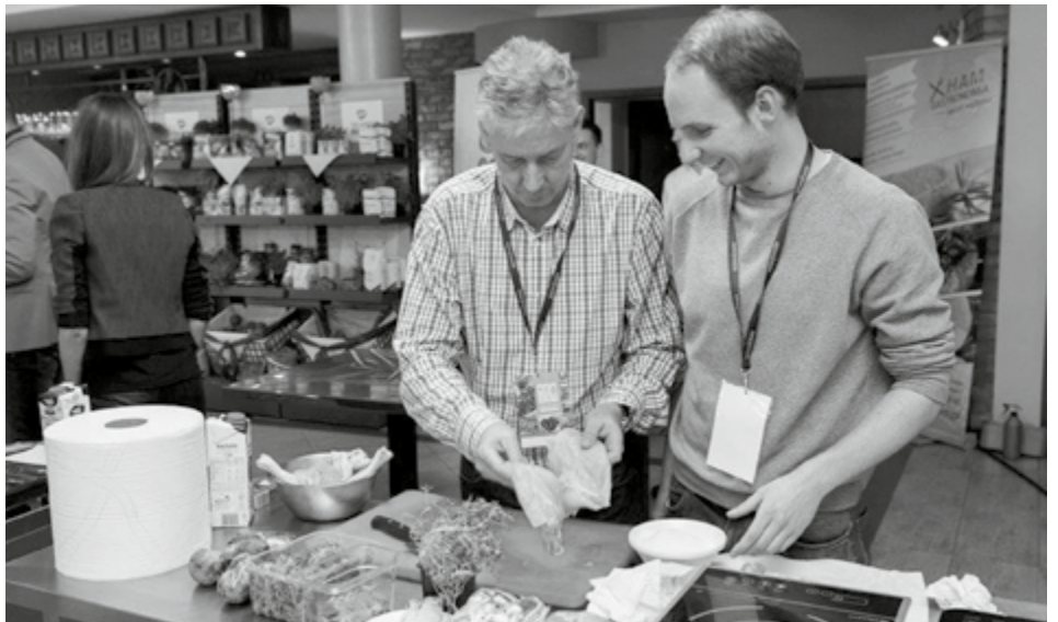
Kulinarne zmagania, mimo że momentami trudne, przyniosły nam wiele radości. Na zdjęciu ekipa „KR”.