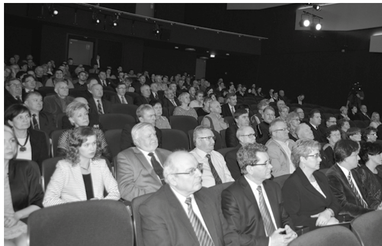
Wśród licznie zgromadzonej publiczności znaleźli się m.in. samorządowcy, przedstawiciele i pracownicy urzędu miasta, reprezentanci oświaty, duszpasterze, przedstawiciele organizacji pozarządowych i przedsiębiorcy