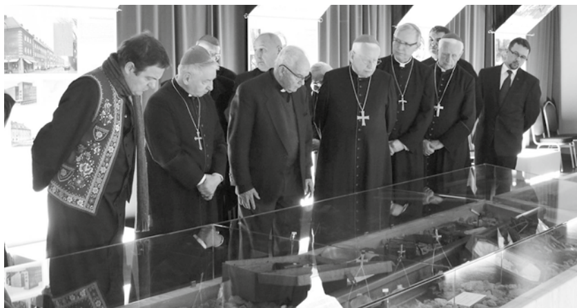
Biskupi odwiedzili Centrum Dokumentacji Deportacji Górnoślązaków do ZSRR w 1945 roku