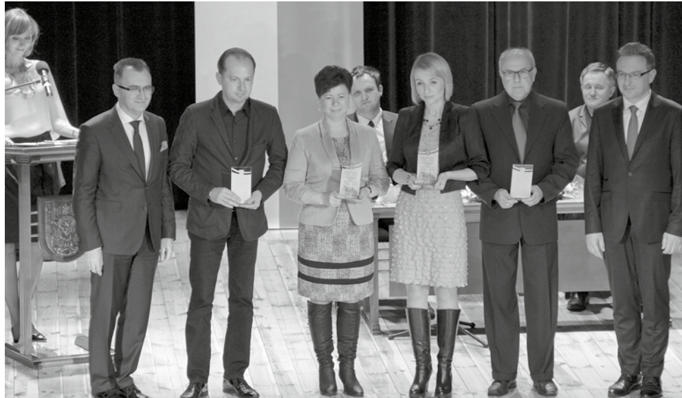
Przedsiębiorcy, którzy 18 lat temu, w roku 1998, założyli własne firmy

w pielegnowanie tradycji i dziedzictwa Górnego Śląska. Wieloletni przyjaciel Radzionkowa. Z jego inicjatywy doszło do rejestracji i transmisji telewizyjnej uroczystych Nieszporów Bożonarodzeniowych w 2014 roku, które rozślawiły nasze miasto. Arcybiskup przyczynił się do stworzenia w Radzionkowie Centrum Dokumentacji Deportacji Górnoszlązaków do ZSRR w 1945 roku, udzielając tej inicjatywie swojego poparcia w regionalnych mediach, homiliach oraz licznych spotkaniach.