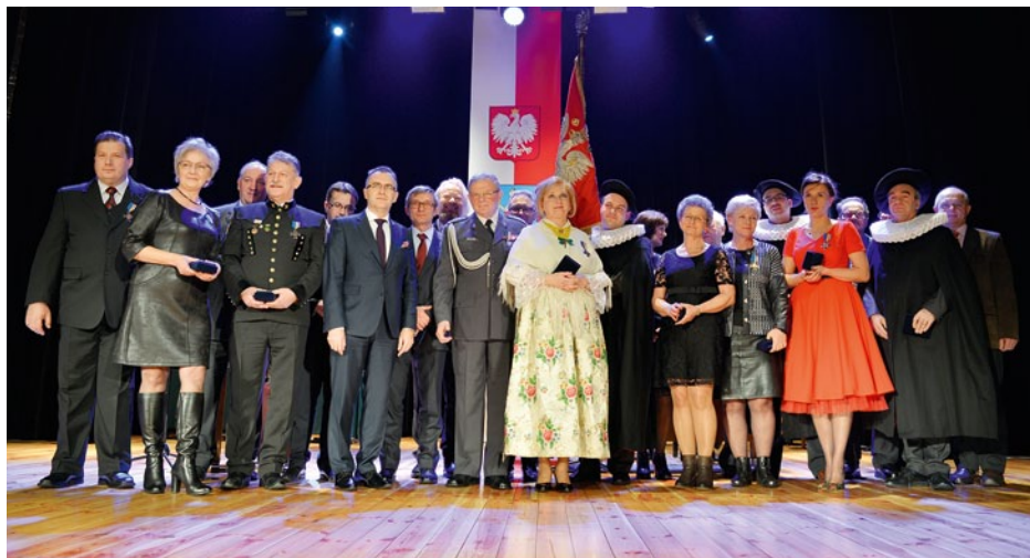
Laureaci nagrody „Cruz Adalberti”