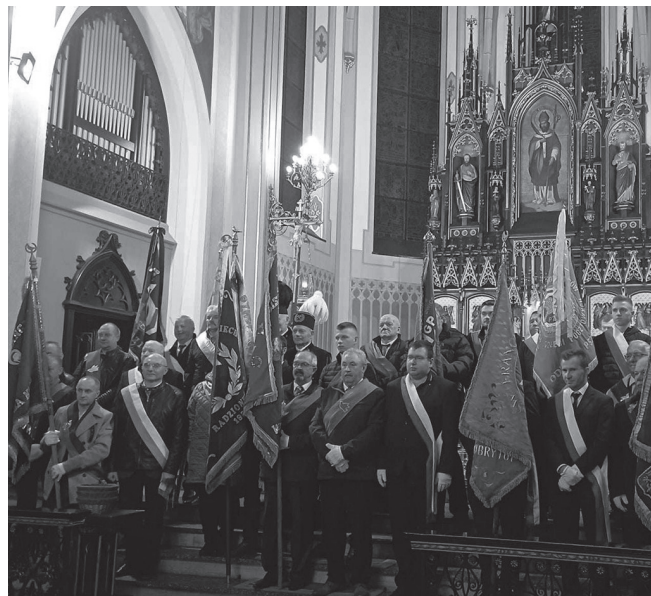
Msza święta w kościele pw. św. Wojciecha.

XIX edycja Śląskich Lotów Dalekodystansowych gołębi pocztowych za nami. W sobotę, 11 listopada, hodowcy z Radzionkowa i zaprzyjaźnionych oddziałów, uroczystie podsumowali sezon.