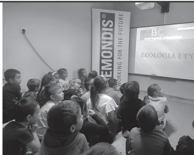
Spotkanie z przedszkolakami.