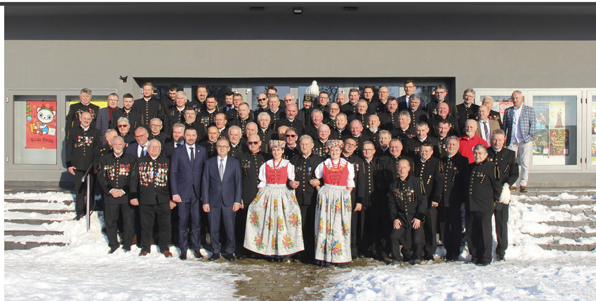
Uczestnicy barbórkowych obchodów.