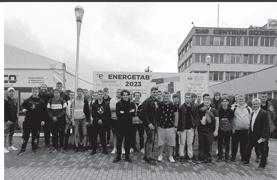
Uczniowie na targach elektroenergetycznych ENERGETAB 2023.