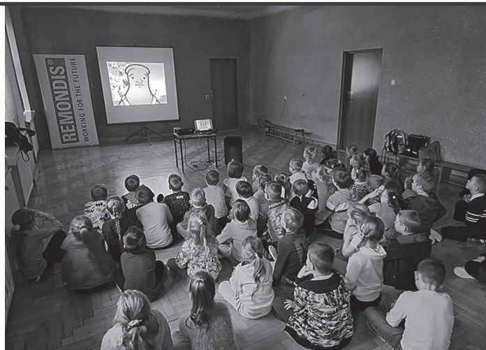
Warsztaty w SP nr 1.