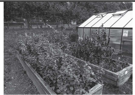
Sadzonki drzew owocowych.

Wiosną 2023 r. w naszym Ogrodzie zaszczerpiono 1114 podkładek, z czego przyjęły się 862 egzemplarze. Najwięcej, bo 651 okazów to jabłonie, a wśród nich takie odmiany jak, m.in. Kosztela, Szara Reneta, Niezrównana Paesgoda, Malinówka, Rubinola, Cesarz Wilhelm, Kronszelska, Antonówka półtorafuntowa. Zrazy przekazali posiadacze starych przydomowych ogródków i niewielkich sadów, sadzonych często rękami ich dziadków. Za interesowanie sadzonkami było bardzo duże, a chętni do ich uprawy pojawili się nie tylko z najbliższej okolicy, ale i z odległych rejonów, np. z Żywca, Bochni, Rybnika, Koszęcina, a nawet Woli Uhruskiej czy Wrocławia. Część drzewek wróciła w ten sposób do swoich właścicieli, część powędrowała do innych. Drzewka zostały posadzone, teraz trzeba poczekać na owoce, co trwa zwykle około 6-10 lat. Do rozdania wiosną pozostało jeszcze 100 sadzonek.