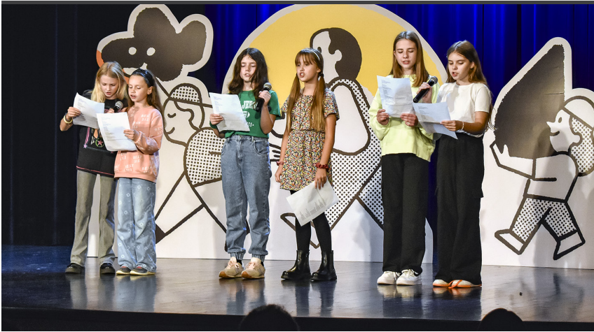
Uczestnicy zajęć wokalnych.