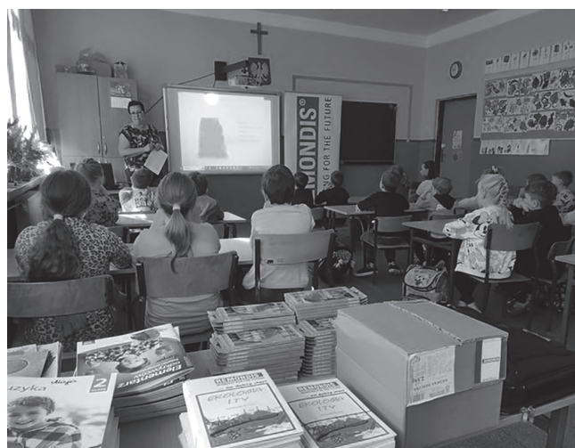
Spotkanie z dziećmi w SP nr 4.

Dziękujemy firmie REMONDIS za przeprowadzenie prelekcji oraz za ufundowane prezenty dla wszystkich uczestników zajęć edukacyjnych.