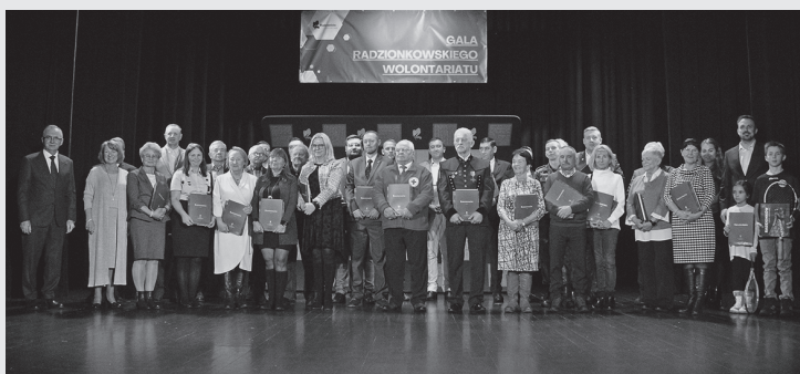
Wyróżnieni przedstawiciele organizacji pozarządowych.

Album, który otrzymali przedstawiciele organizacji, zawiera zdjęcia ukazujące różne oblicza Radzionkowa. W publikacji znajdziemy zarówno archiwalne kadry, jak i fotografie przedstawiające tradycyjną śląską architekturę, nowoczesne obiekty, które powstały w gminie i dokumentujące najważniejsze wydarzenia. Na 192 stronach zamieszczono 143 zdjęcia. Wydawnictwo, w cenie 50 zł, dostępne jest w Miejskiej Bibliotece Publicznej.