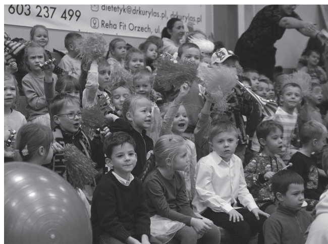
Publiczność żywiołowo dopingowała zawodników.

Choć mali wzrostem, często są najbardziej zaangażowani i zdeterminowani. Przedszkolacy, bo o nich mowa, rywalizowali 29 listopada na hali MOSiRu w sportowej olimpiadzie.