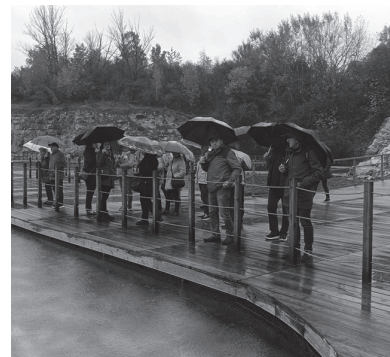
Spacer po Parku Zakrzówek.

24 października grupa radzionkowskich seniorów udała się na wycieczkę do czeskiej Opawy oraz Hradcu nad Moravicí.