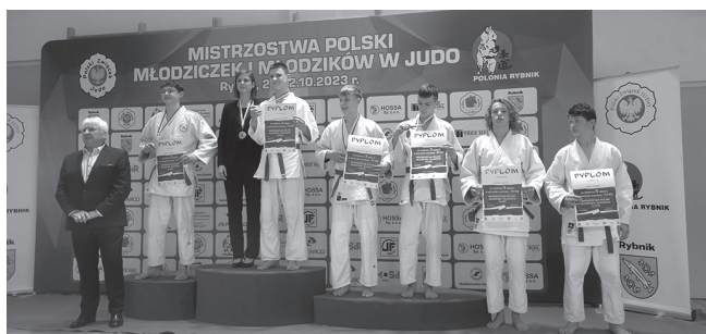
Najlepsi zawodnicy na podium.

Nasi judocy osiągają spore sukcesy sportowe.