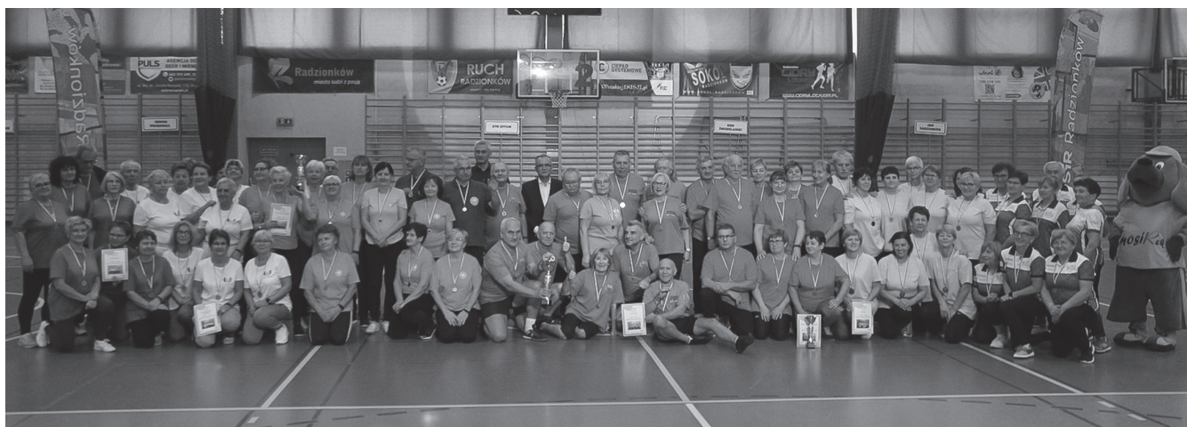
Uczestnicy seniorskiej olimpiady.

Seniorzy mają swoją Olimpiadę Sportową. Jej siódma edycja odbyła się 14 października, w Światowy Dzień Seniora, jak zwykle na hali MOSiR.