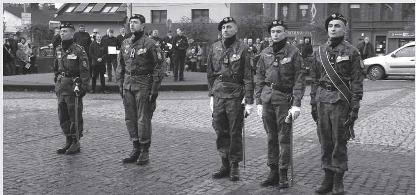
Odnaczeni członkowie Stowarzyszenia.

Pod Pomnikiem Powstańców Śląskich na Placu Letochów 11 listopada odbyły się uroczystości Narodowego Święta Niepodległości. Wiązanki złożyli przedstawiciele samorządu miasta i powiatu, miejskich jednostek organizacyjnych, służb mundurowych i organizacji pozarządowych.