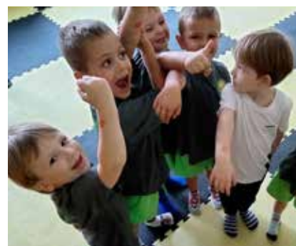
Uczestnicy Akademii Malucha.