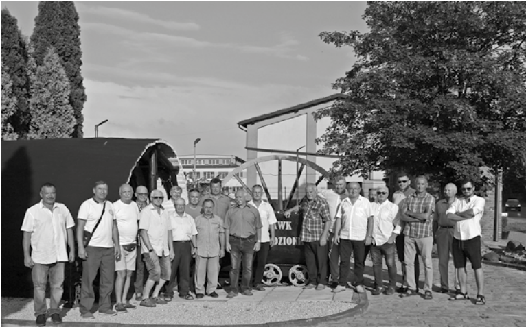
Uczestnicy spotkania na terenie Miniskansenu Górniczego.

W połowie sierpnia na terenie Miniskansenu Górniczego przy ulicy Nałkowskiej odbyło się okolicznościowe spotkanie Klubu Emerytów Górniczych z przedstawicielami radzionkowskiego samorządu.