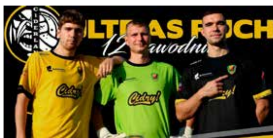
Nowe stroje dla piłkarzy ufundowali kibice.

„Ruch” Radzionków w wygranym 3:2 spotkaniu z drużyną „Sparty” Katowice wystąpił w nowych strojach meczowych.