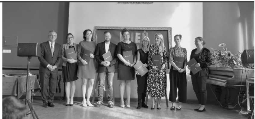
Nauczyciele odebrali nagrody za osiągnięcia dydaktyczno-wychowawcze.