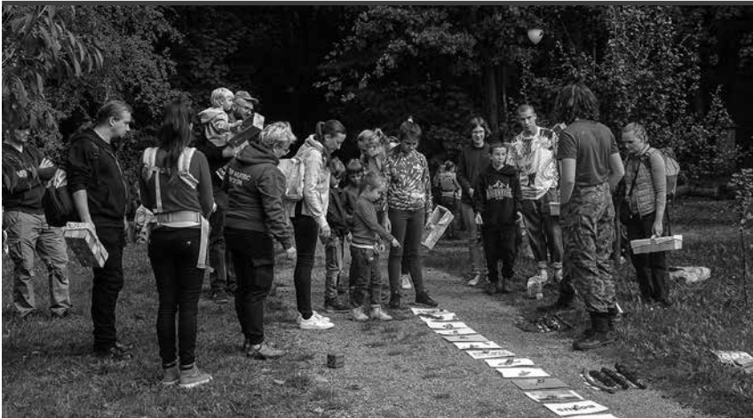
Prelekcja dla grzybiarzy.