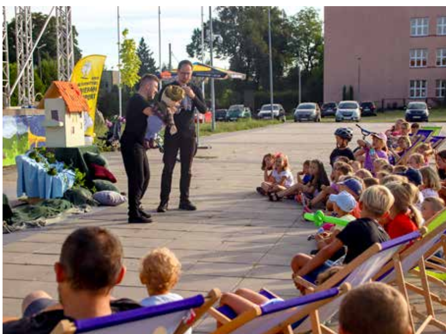
Spektakl plenerowy Grupy O! Teatr.

Przedsięwzięcie dofinansowano ze środków Ministra Kultury i Dziedzictwa Narodowego w ramach programu Narodowego Centrum Kultury: Kultura-Interwencje. Edycja 2023.