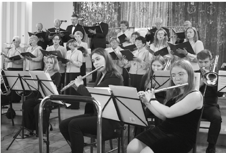
Występ dostarczył słuchaczom wielu wzruszeń.

Okazją do rozmowy była 152. rocznica uruchomienia radzionkowskiej kopalni oraz zakończenie kolejnego etapu prac renowacyjnych na terenie skansenu. Wszystkich, którym bliska jest historia górnictwa i naszej małej ojczyzny zapraszamy do odwiedzenia tego wyjątkowego miejsca na mapie Radzionkowa.