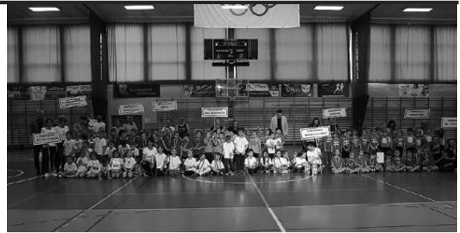
Najmłodzi wykazali się dużym zaangażowaniem.