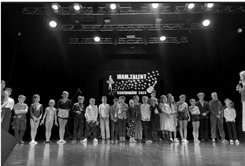
Talenty na scenie „Karolinki”.