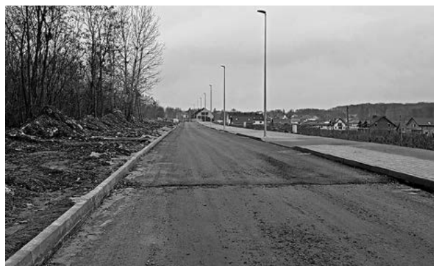
ul. Marii Dąbrowskiej.

Kolejny etap objął wykonanie okablowania oświetlenia ulicznego, położenie warstw konstrukcyjnych podbudowy oraz ułożenie krawężników na całej długości (poza skrzyżowaniami). Koszt inwestycji to ponad 6,4 mln zł.