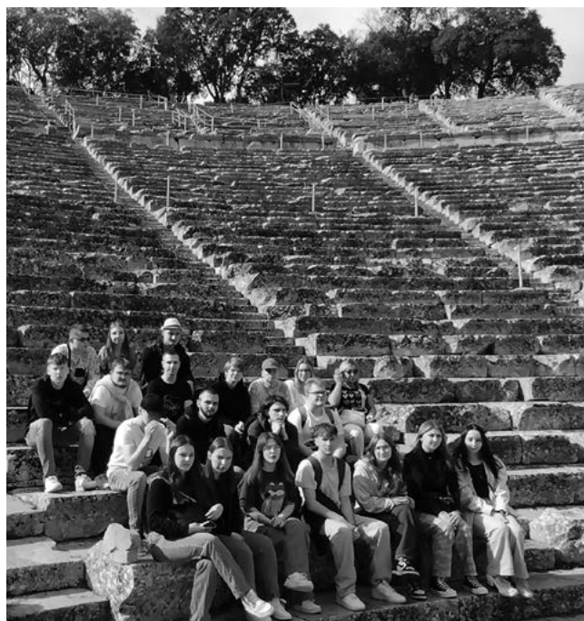
Uczniowie odkrywali zabytki w Grecji.