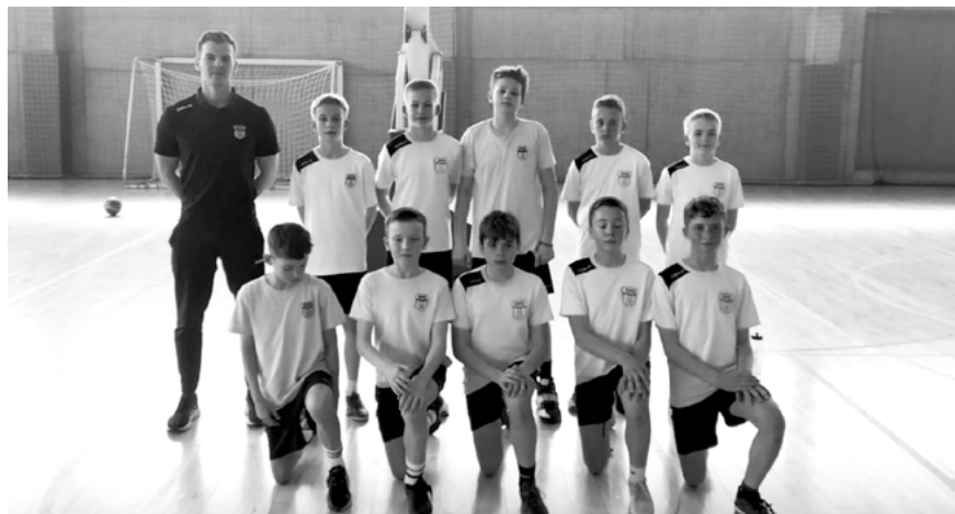
Nasi zawodnicy w turnieju koszykówki zajęli II miejsce.

Uczniowie SMS Radzionków z rocznika 2010 oraz 2011 (klasy V i VI szkoły podstawowej) reprezentowali w ostatnim czasie miasto Radzionków w zawodach Rejonowych w Minikoszykówce Chłopców oraz w Zawodach Powiatowych w Minisiatkówce Chłopców.