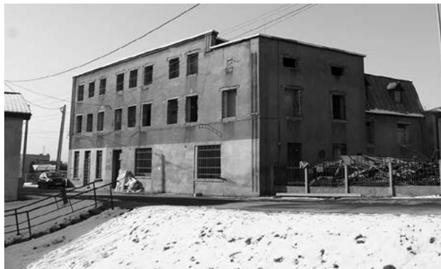
Biblioteka powstaje w dawnej restauracji „U Blachuta”.

Prace modernizacyjne dawnej restauracji „U Blachuta” wchodzą w decydującą fazę. Po remoncie będzie się tam mieścić Miejska Biblioteka Publiczna.