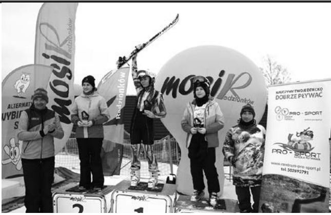
Najlepsi zawodnicy na podium.