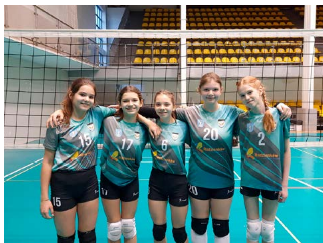
Zawodniczki drużyny „Sokół 2”.