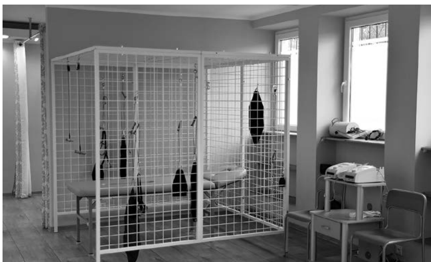
Dom dysponuje m.in. nowoczesną salą rehabilitacyjną.

Więcej informacji można uzyskać w „Senior Centrum”, które mieści się przy ul. Kuźaja 13 lub pod nr tel. 32 282 86 84, 501 079 247, 505 078 655.