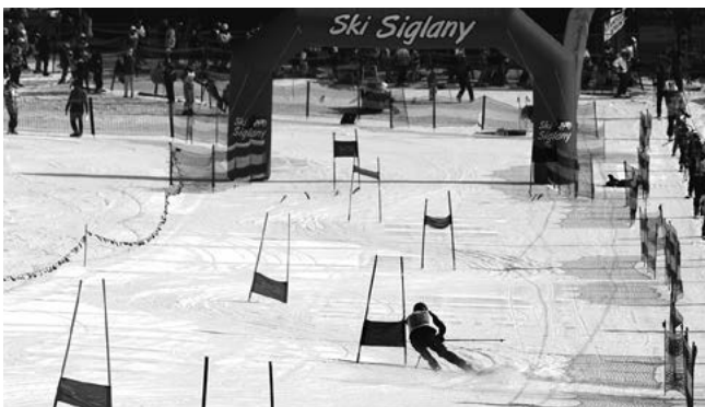
Zawody rozegrano przy pięknej pogodzie.

Dziękujemy również za wsparcie finansowe Urzędowi Miasta Radzionków. Wyniki na Facebooku oraz na stronie: www.slalom.com.pl/wyniki . Do zobaczenia za rok.