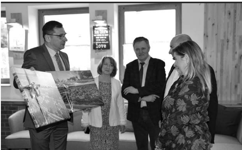
Oficjalne otwarcie Dziennego Domu Opieki „Senior Centrum”.