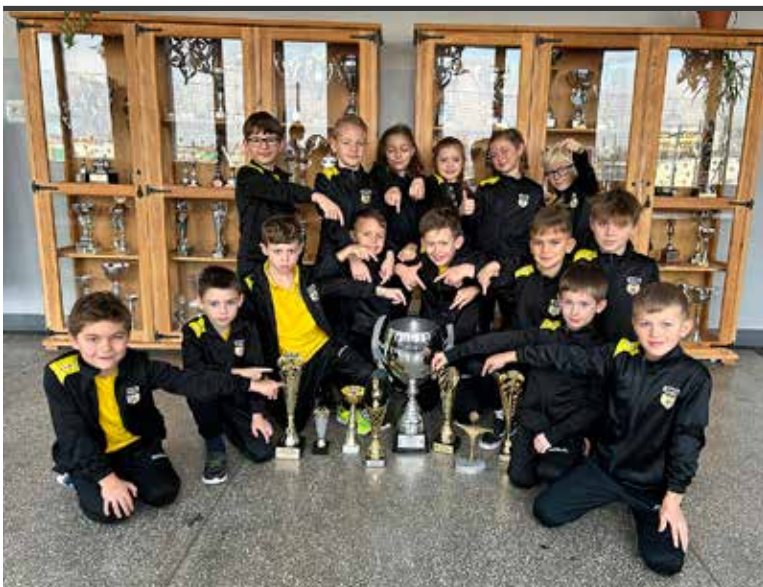
Uczniowie szkoły regularnie zdobywają nagrody i wyróżnienia.