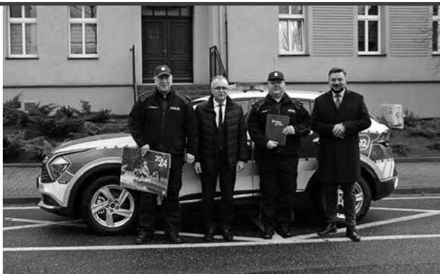
Uroczyste przekazanie radiowozu.