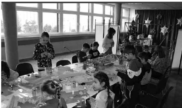
Ubiegłoroczne warsztaty zorganizowane w ramach „Zimolinki”.