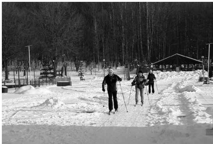
Książ Góra to idealne miejsce do uprawiania sportów zimowych.

Nowe imprezy sportowe i wydarzenia, kilka drobnych inwestycji i nieustanny rozwój oferty dla wszystkich mieszkańców – takie cele stawia sobie Miejski Ośrodek Sportu i Rekreacji w 2024 roku. Co nas czeka?