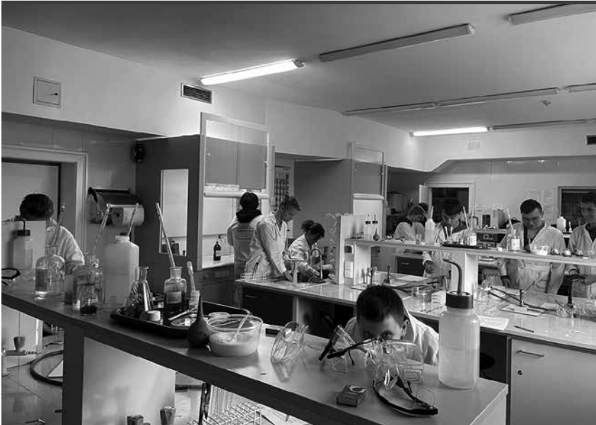
Zajęcia chemiczne w Pałacu Młodzieży w Katowicach.