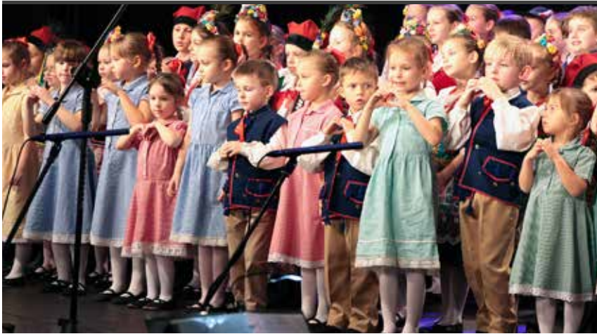
Występy najmłodszych członków zespołu „Mały Śląsk”.