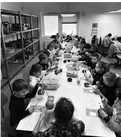
Nasi uczniowie w trakcie warsztatów.

Klasy 1a i 1b Szkoły Podstawowej Nr 4 pojechały na warsztaty zdobienia do Fabryki Bombek w Miechowie niedaleko Krakowa.