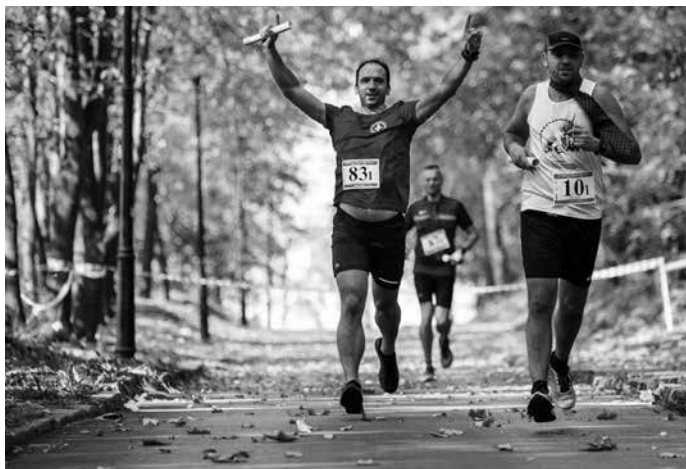
Sztafetowy Maraton Miast i Gmin od lat cieszy się dużym zainteresowaniem biegaczy.