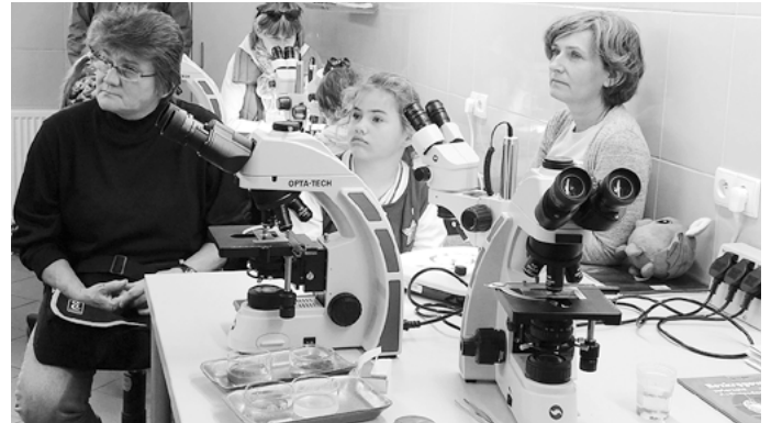
W laboratorium uczestnicy badali wodę z okolicznych wód

W ostatnią niedzielę września świętowaliśmy Dzień Rzeki. To był prawdziwie przyjemny jesienny dzień.